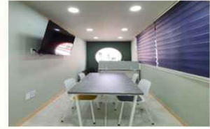
사무실 및 회의실 (2F) 지역과 공유를 위한 커뮤니티 공간