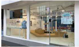
창업부스실 (1F) 캠퍼스타운 입주 창업기업 상품 전시실 및 홍보 영상관