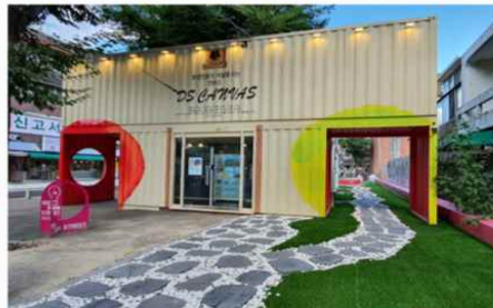
※시반(창업체험)거리 입구 / 멀티실(1F), 사무실 및 회의실(2F)

시반(See Bahn)은 1. '시작이 반이다'의 의미와, 2. 영어로 '경험하다'의 'SEE' + 독일어 '거리'의 'BAHN'으로 구성되어 창업을 경험할 수 있는 거리라는 의미를 담고있는 컨테이너형 창업 공간