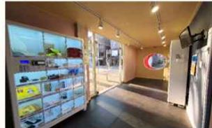
멀티실 (1F) 소자본 예비 창업인이 실제 창업을 개시하기 전에 상품 판매 또는 운영을 경험해 볼 수 있는 공간 덕성여대 학생이 제작한 K-MAKERS 상품을 거래하는 OPEN장터